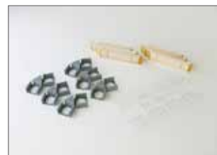
▲ <ヘキサゴン>スターターキット

コラージュクリップを使用してフレームの裏面から複数のフレームを連結することができます。