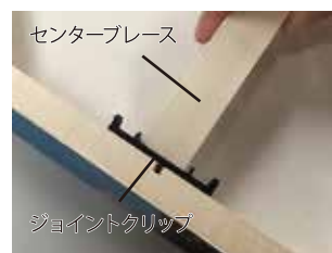
▲ センタープレースの取り付け