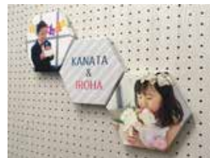
▲ コラージュクリップで連結