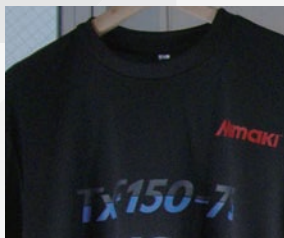
スポーツウェア(ポリエステル)