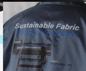
ウインドブレーカー(ナイロン)