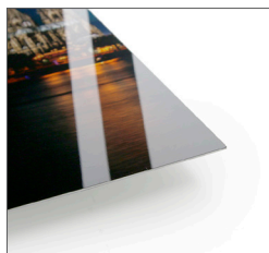
超光沢フォトパネル イルフォクローム

超光沢フォトパネル「イルフォクローム」をはじめ、キーチェーンやコースター、トートバッグなどのグッズも小ロットからお作りいただけます。導入後すぐにお店の新商品や販促グッズとしてお使いいただくことが可能です。